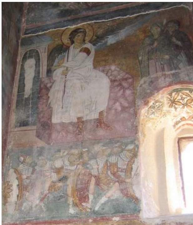
Slika 1. Freska -manastir Mileševa

andjela poslat je u svemir prema mogućim vanzemaljskim oblicima života, jer je Beli andjeo odabran za simbol svekolikog mira.