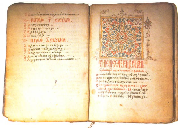
Slika 2. Prizrenski prepis Dušanovog Zakonika (XV vek)

Na Slici 2. prikazan je Prizrenski prepis Dušanovog Zakonika (XV vek), koji se danas nalazi i čuva u Narodnom muzeju u Beogradu.