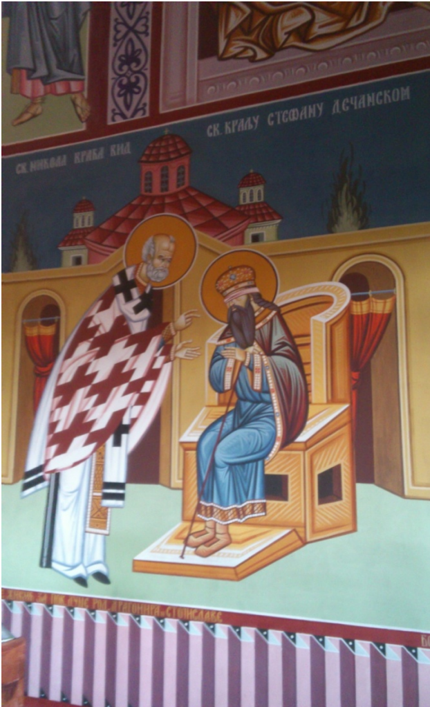
Slika 3. Freska "Sveti Nikola vraća vid sv. kralju Stefanu Dečanskom" oslikana na zidinama crkve Svetog Nikole (Niš)

Na živopisu se vidi kako sveti Nikola prilazi oslepljenom Urošu III, čije su oči vezane i pokrivene belom maramom. Kralj Uroš III ima štap braon boje koji mu je služio za kretanje. Uz pomoć svoje isceljitejske moći sveti Nikola vraća vid Urošu III.